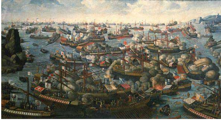
LA BATAILLE DE LÉPANTE

Le 7 Octobre, 1571 une flotte composée des forces combinées de Naples, de Sardaigne, Venise, de la Papauté, Gênes, la Savoie et les Chevaliers de Malte, a combattu une intense bataille contre la flotte de l'Empire ottoman. La bataille a eu lieu dans le golfe de Corinthe, en Grèce occidentale. Bien que les forces ottomanes fussent numériquement supérieures, la « Sainte Ligue » a connu une plus grande puissance de feu et a prévalu. Cette victoire a considérablement réduit la mire de contrôle Empire ottoman sur la Méditerranée, provoquant un changement d'époque dans les relations internationales de l'Est à l'Ouest. D'une certaine manière, et elle ne serait absolument pas exagéré, le monde que nous connaissons est le résultat de cette victoire, connu dans l'histoire comme « la bataille de Lépante ».