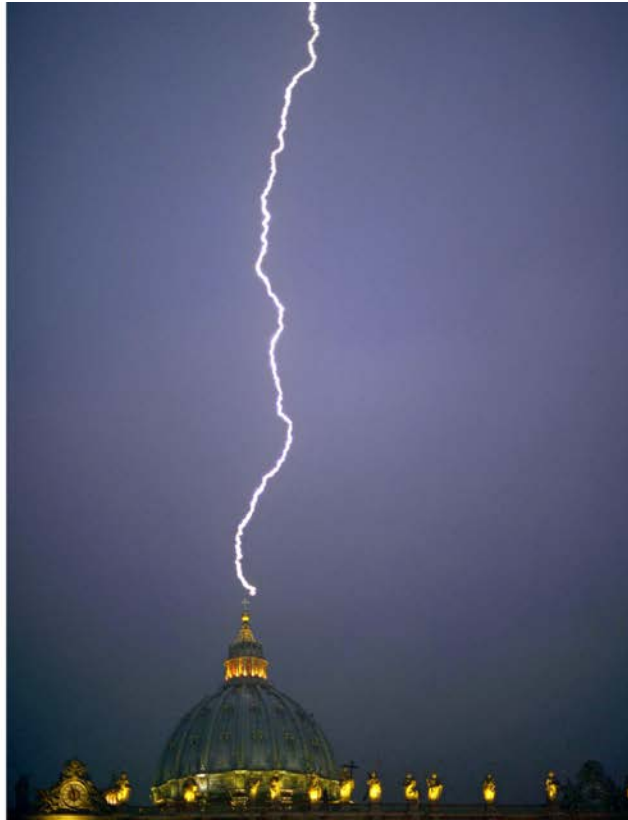
LE COUP DE Foudre QUI A FRAPPÉ LE DÔME DE SAINT-PIERRE AU VATICAN, LE 11 FÉVRIER, 2013.

L'éclair du 7 Octobre a encore frappé le Vatican au cours d'une fête mariale : Notre-Dame du Rosaire.