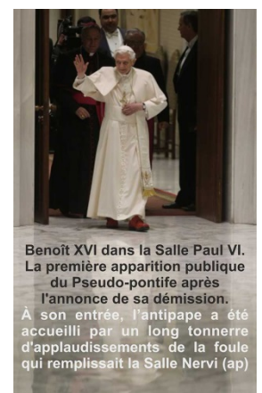
Benoît XVI dans la Salle Paul VI. La première apparition publique du Pseudo-pontife après l'annonce de sa démission. À son entrée, l'antipape a été accueilli par un long tonnerre d'applaudissements de la foule qui remplissait la Salle Nervi

(Le long tonnerre d'applaudissements de la foule qui remplissait la Salle Nervi, fut donc précédé du Tonnerre de Dieu !)