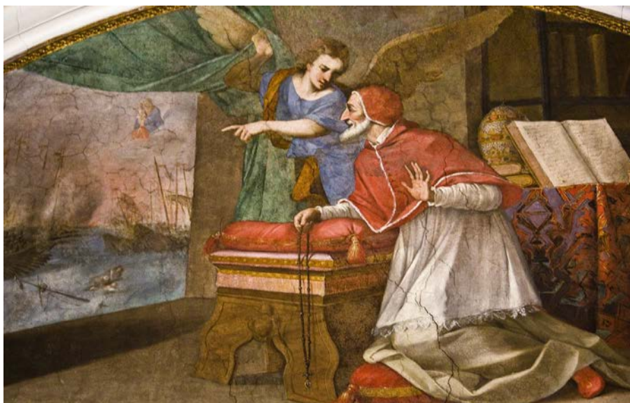
LE PAPE DOMINICAIN PIE V PRIANT LE ROSAIRE PENDANT LA BATAILLE DE LÉPANTE

Les biographes nous disent que, après la conclusion de la bataille de Lépante, le pape Pie V se leva et alla à la fenêtre, tournant son regard vers l'est. Puis il se retourna et dit : « la flotte chrétienne est victorieuse ! » et versa des larmes de remerciement.