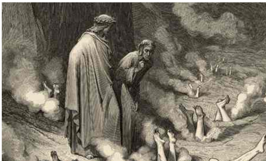
Une gravure de Gustave Doré pour la Canto 19 de la Divine Comédie de Dante.

Un fantôme ? Pas du tout. Gherush92 , l'organisation italienne des droits de l'homme , qui officie auprès des Nations Unies , a déjà demandé que Dante soit retiré des programmes scolaires au nom de sa prétendue « islamophobie ».