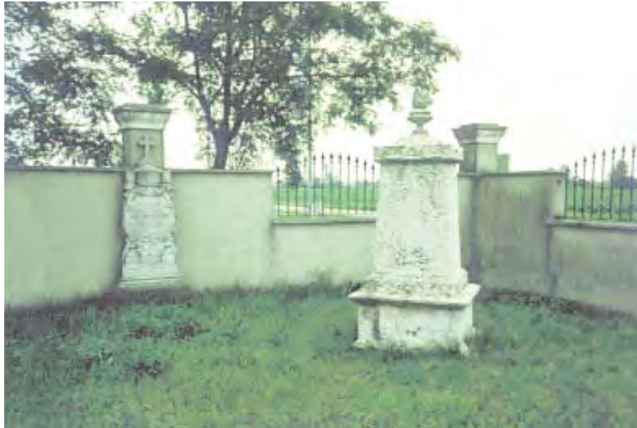
Une photo récente de ce qui est resté des tombes de la famille des Alghisi, au cimetière de Verolavecchia, dans la province de Brescia.

À droite: détail de la partie inférieure de la tombe de Giuditta Alghisi , mère de Paul VI, sur laquelle apparaissent des symboles maçonniques.