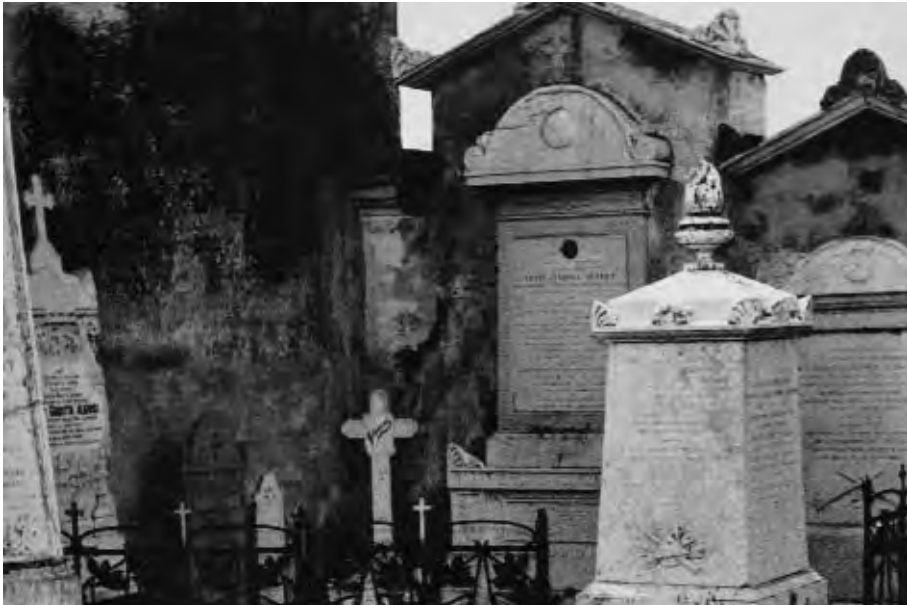
Une vieille photo de la tombe de la famille Alghisi , au cimetière de Verolavecchia, dans la province Brescia.