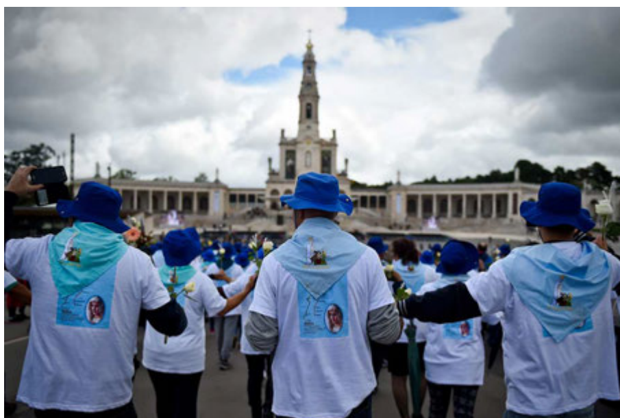
Des pèlerins devant Notre-Dame de Fatima. Fatima, au centre du Portugal, le 11 mai 2017.

Fellay et Bergoglio se rencontrent officiellement le 13 mai, centenaire de l'apparition de Fátima.