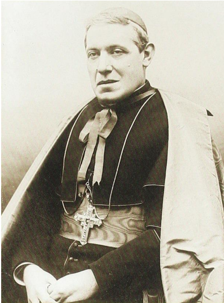
Mariano Rampolla del Tindaro, né à Polizzi Generosa, en Sicile, le 17 août 1843 et mort à Rome le 16 décembre 1913, était un cardinal italien, cardinal secrétaire d'État de Léon XIII