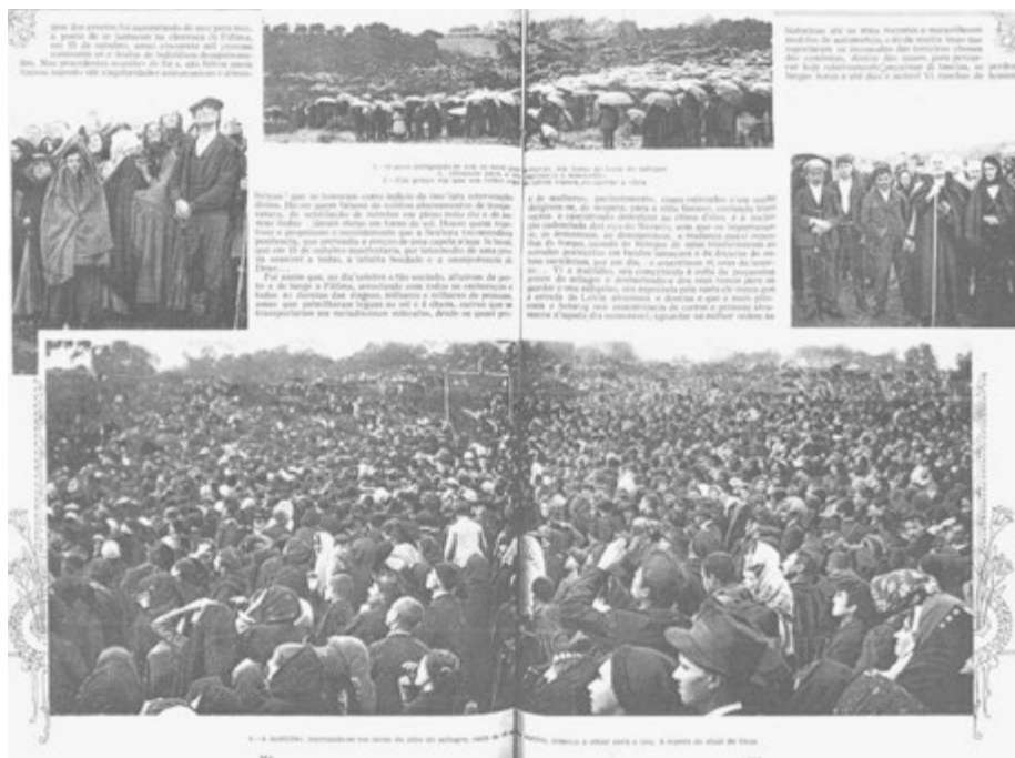
Le Miracle du soleil vu par 70.000 personnes sur place et par plus de 200.000 autres personnes dans un rayon de 60 km autour de l'Apparition.