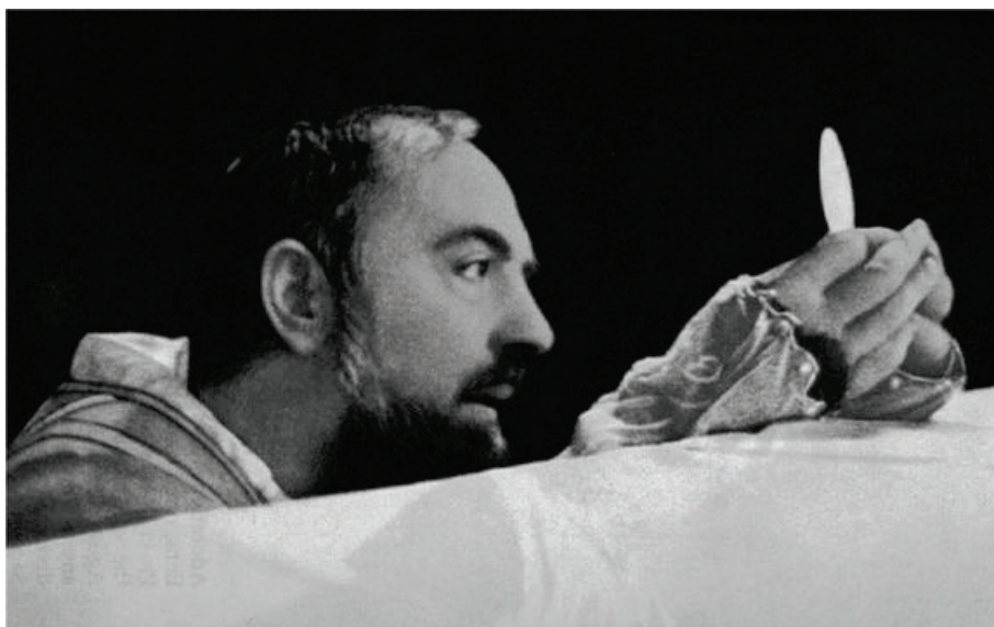
Padre Pio di Pietrelcina à la Consécration

La prière qui suit, qu'il récitait pendant son action de grâces après la Sainte Messe développe et personnalise la supplication que firent les disciples d'Emmaüs au Christ ressuscité au terme du chemin qu'ils avaient parcouru avec Lui sans Le reconnaître : « Mane nobiscum, quoniam advesperascit, et inclinata est iam dies : Demeurez avec nous, car le soir arrive, et le jour est déjà sur son déclin » (Luc XXIV, 29).