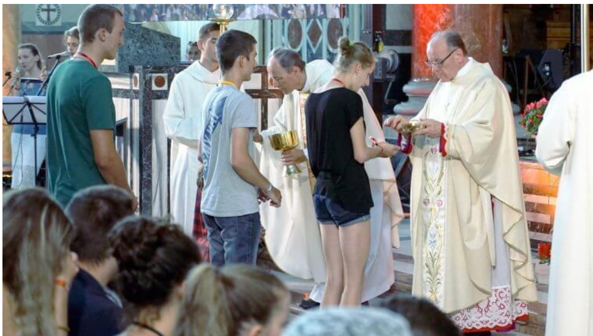
Le pseudo-“Mgr” Huonder lors des JMJ alémaniques le 8 juillet 2017 à la basilique Notre-Dame de Zurich Futur “ consécréteur ” invalide des futurs pseudo-évêques invalides de la FSSPX

Sur la fin de son parcours, à partir de 2011, il fait parler de lui en sanctionnant un pseudo-prêtre qui a donné une ‘ bénédictio nuptiale ’ à un couple de femmes inverties :