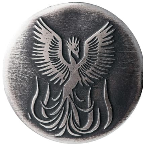
Un symbole bien-aimé du NWO : le phénix renaît de ses cendres, représentant la renaissance et le nouveau, suite à la destruction de l'ancien

Dans le cas du Coronavirus, l'objectif final est la nouvelle normalité dans laquelle tout le monde est définitivement séparé et déconnecté les uns des autres, suivi dans ses contacts, surveillé, supervisé, médicalement et vacciné. La distanciation sociale est en réalité une distanciation antisociale . Il s'agit de supprimer la touche humaine de nos interactions. Ce contact est ce qui nous rend humains. Un symbole bien-aimé du Nouvel Ordre Mondial est le phénix renaissant de ses cendres, représentant la renaissance et le nouveau qui suivent la destruction de l'ancien. [Est-ce dont un hasard s'il était prévu d'appeler la monnaie unique du Nouvel Ordre Mondial , le Phénix ?]