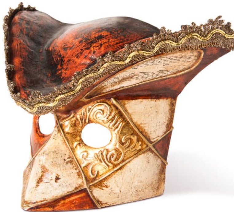
Masque de Rituel d'Initiation Corona-19(84)

Le texte ci-dessous est tiré de CHIESA VIVA, janvier 2021, de l'article « Coronavirus, il rituale occulto di iniziazion » (traduction Laurent Glauzy)