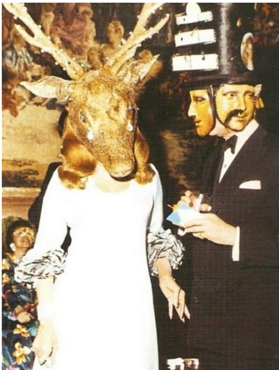
Masques du Rothschild «Illuminati Ball» Deux hôtes sont habillés comme le baron et la baronne de Rothschild lors de leur tristement célèbre bal de 1972. L'invité de droite portant un masque à plusieurs visages.

Le masque symbole de soumission, déshumanisation, renforce par ailleurs une fausse idée de danger et de personnalité alternative.