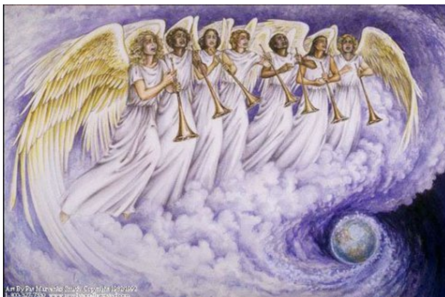
Les 7 trompettes de l'Apocalypse de St Jean

Nous savons comment cela va marcher. Les sept trompettes de l'Apocalypse nous donnent un aperçu.