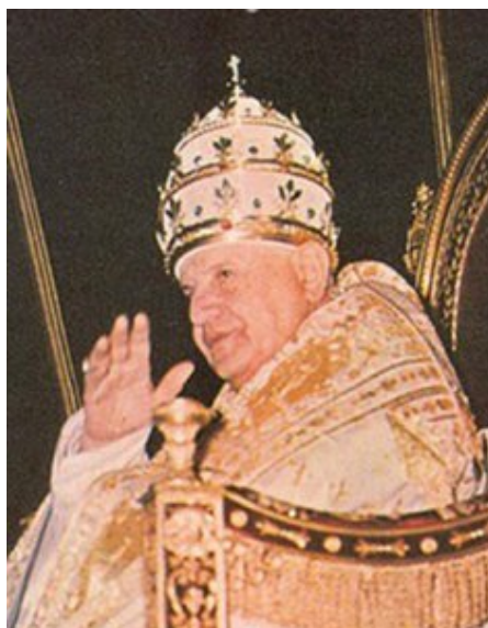
Angelo Roncalli – Antipape Jean XXIII (1958-1963)

Ce que vous devez savoir sur « Saint » Jean XXIII, Angelo Roncalli, l'homme qui a prétendu être le pape de l'Église catholique de 1958 à 1963