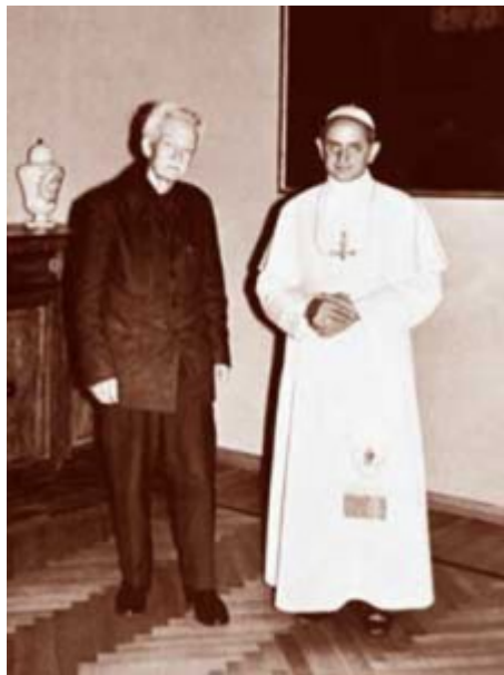
Paul VI avec Maritain

Le mentor philosophique de Paul VI était Jacques Maritain (1882-1973), dont le livre de 1936 Humanisme Intégral a été publié sans le nihil obstat requis ni l' imprimatur , et il est facile de voir pourquoi : Il enseigne un marxisme « chrétien » et donne un plan pensé pour Vatican II.