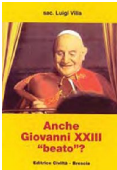
John XXIII a "Blessed" Too?

Pour les anglophones (ce document n'existe pas en français) :