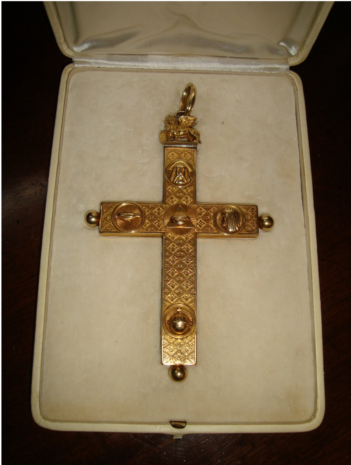
Croix pectorale de Jean XXIII, réplique "commémorative". L'originale a été donnée par lui-même, lorsqu'il a été élu illégalement "pape" conciliaire, à la basilique Saint-Ambroise de Milan.