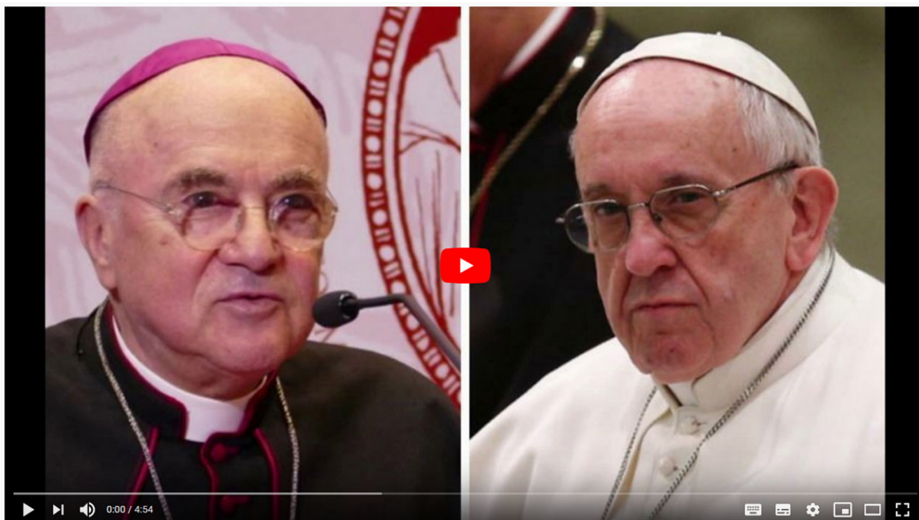
Le Pape BERGOGLIO Abandonne le Titre de Vicaire du Christ - Viganò réagit

L'hérétique Bergoglio est toujours, pour l'abbé Viganò — comme pour la F$$PX —, le Vicaire du Christ, bien qu'il lui reproche d'abandonner le « Titre de Vicaire du Christ » :